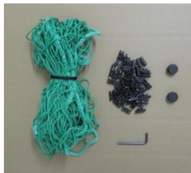
Obsah sáčku s příslušenstvím